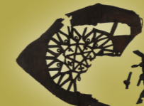
Damenschuh (14. Jhd.)